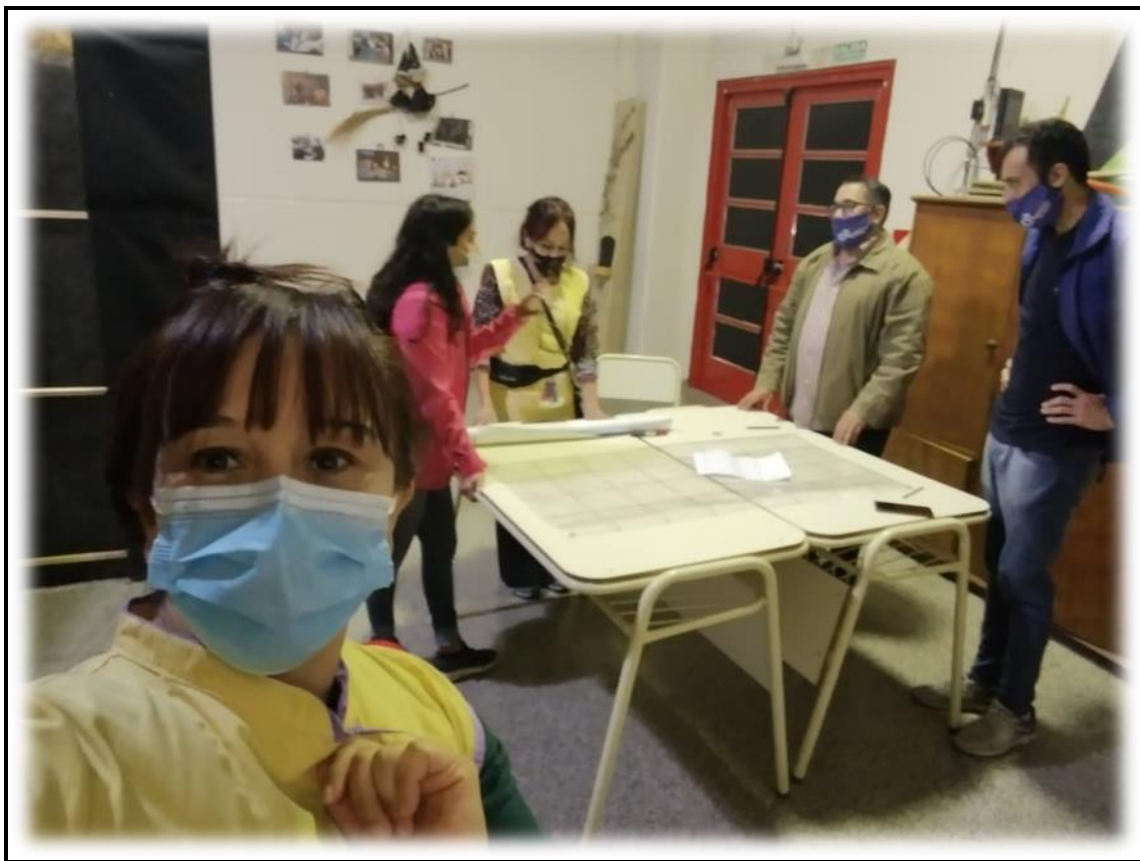
2SEGUNDO ENCUENTRO CON PROTOCOLO SE REALIZÓ EN EL SUM- PLANIFICACIÓN Y CREACIÓN DEL BOCETO.