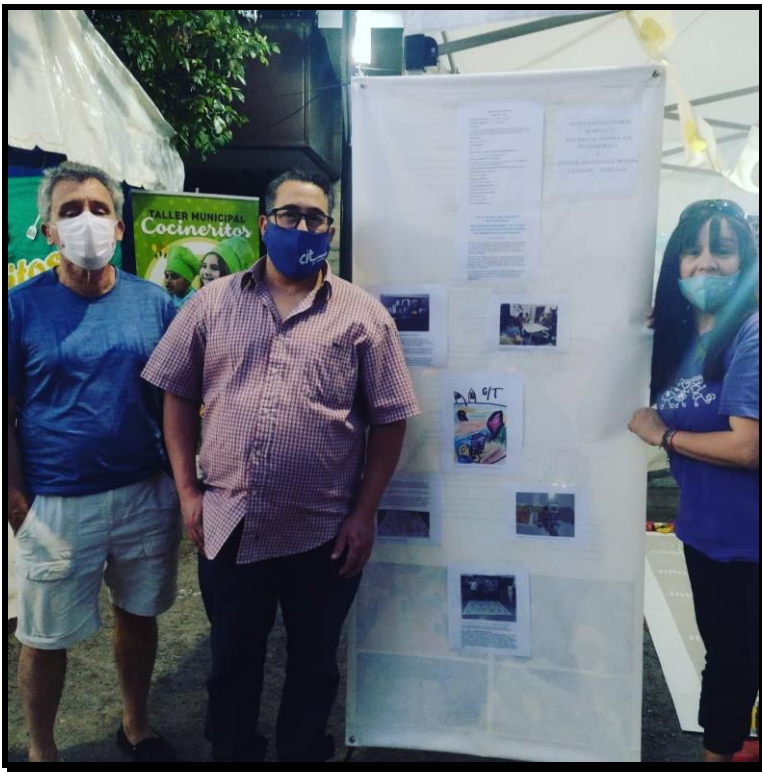
Personal Del CIT

PUNTOS CENTRALES DE LA CIUDAD DE LA FALDA PARA USAR EL CÓDIGO QR CADA LINK TE LLEVA A UN VIDEO REALIZADO POR LOS ESTUDIANTES QUIENES EXPLICAN, COMENTAN BREVEMENTE A QUE PUNTO REFERENCIAL PERTENECE.